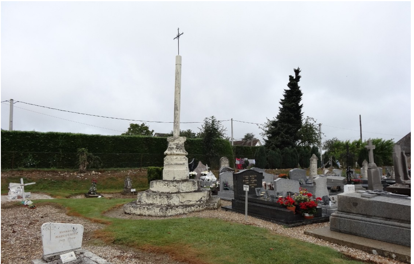
Photographie du monument historique